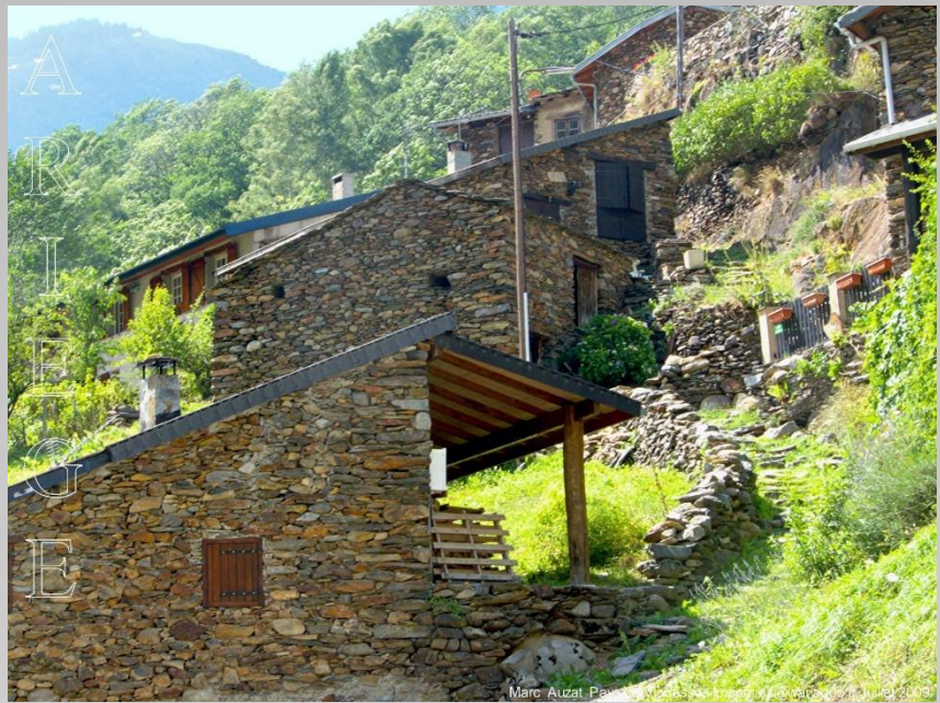
Marc, Auzat, Pays de Vicdessos, juillet 2009

Le hameau de Marc est caractérisé par des petites maisons typiques, faites en pierres.