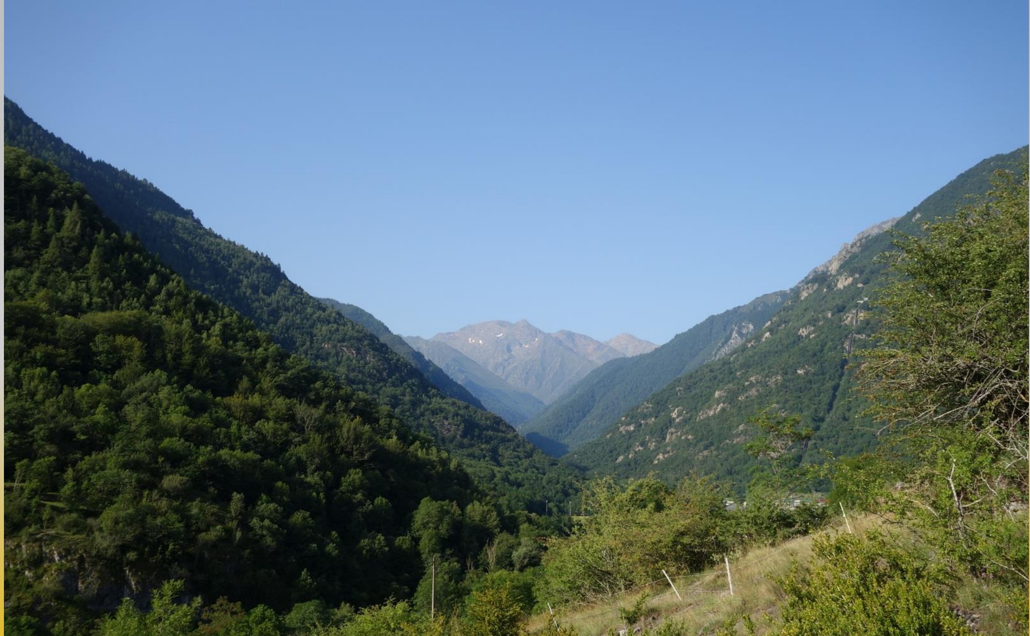
Vue sur la vallée du Vicdessos et le Montcalm en fond